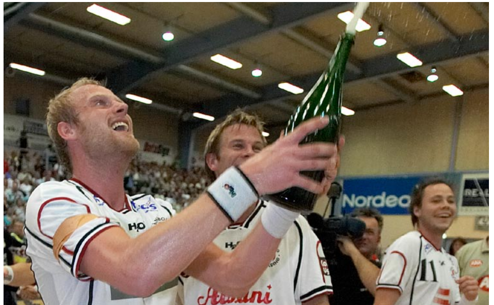
Kolding vandt i sidste sæson det sjette DM-guld siden 1993.