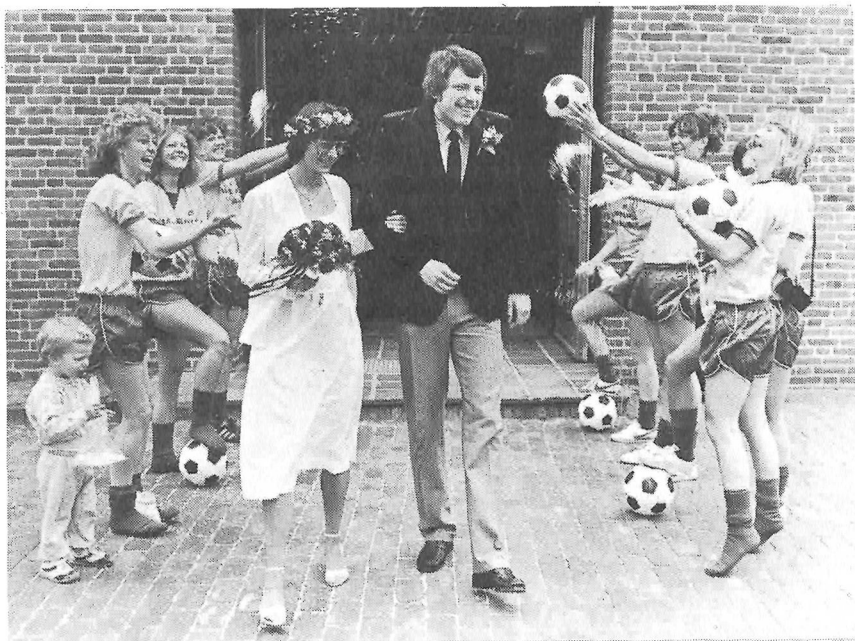
Fodboldbryllup 1983. To fodboldspillere fra Skovlunde Idrætsforening hylides efter vilsen af deres kammerater.

Damerne synger om, hvor de kommer fra og hvordan de er, hvilke egenskaber de forbinder med sig selv som kvinder og som fodboldspillere. Herrerne