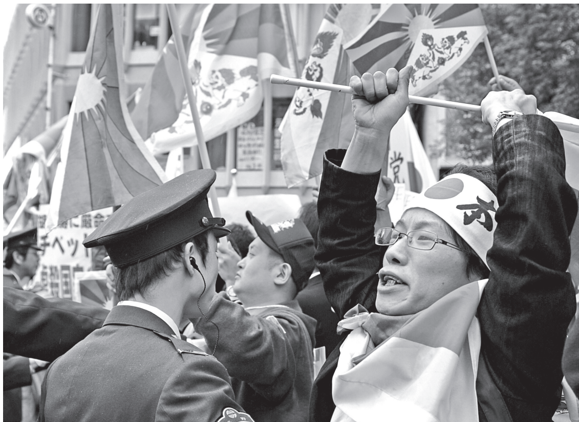
Ordensmagten kontrollerer pro-tibetanske demonstranter i forbindelse med den olympiske fakkelstafet gennem Nagano den 26. april 2008. Ifølge vidner endte denne japanske del af fakkelstafetten i et fire timers voldsomt slagsmål, hvor fire mennesker kom til skade (AFP PHOTO/Kazuhiro NOGI, Scanpix, Danmark).

gen før OL: »I think really there was an attempt to avoid promising anything, rather than an attempt to make promises. That human right groups have been saying China made promises, I think that's wishful thinking. I understand why they're doing that – it's a political strategy. But I am a social scientist, and from that perspective, that's just not true« (Badger, 2008). Som man kan se af referencerne, er det små ukendte me-