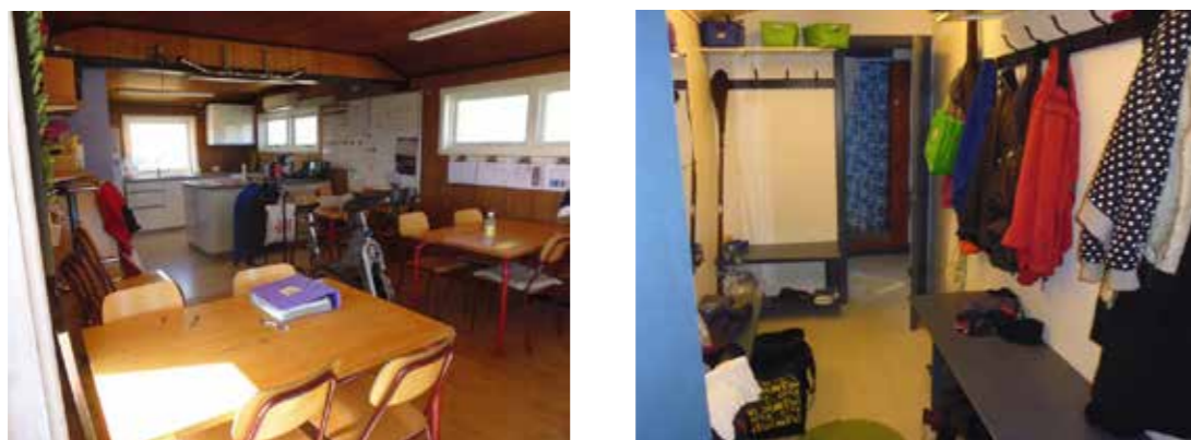
Klubhusets primære rum er et køkkenalrum med spiseborde og kajakergometre og andre træningsredskaber, der står ind mellem bordene, og som bruges til vintertræning (tv). På billedet til højre ses det ene omklædnings- og opbevaringsrum samt bruserumfaciliteterne i baggrunden.

Foreningens klubhus er indrettet med en opholdsstue og køkkenfaciliteter i et samlet rum, hvor klubbens to kajakergometre også er placeret. Det er småt med pladsen i foreningens klubhus og omklædningsfaciliteterne består af to primitive bade-nicher med forhæng. Derudover rummer klubhuset to aflange rum, der anvendes til omklædning samt ophæng af veste, kajakgrej og udstyr.