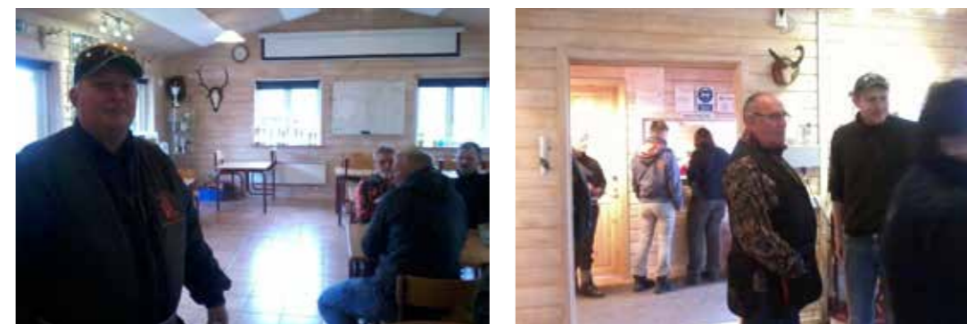
Det store opholdsrum med caféen og langborde (tv.) samt kig til entréen og klubhusets kontor, hvor medlemmerne står i kø for at indskrive sig til en tur på skydebanen i Hedehusene-Fløng Jagtforenings klubhus ved Skydebane Vest (th)

Caféen er udelukkende drevet af frivillige, og har åbent hver tirsdag og onsdag aften i det tidsrum, hvor der skydes. Derudover indeholder klubhuset et kontor med åbning ud til entréen. Det er her medlemmerne står i kø for at indskrive sig til en tur på skydebanen. Og endelig rummer klubhuset et større redskabsrum med et aflåst skab til geværer mv.