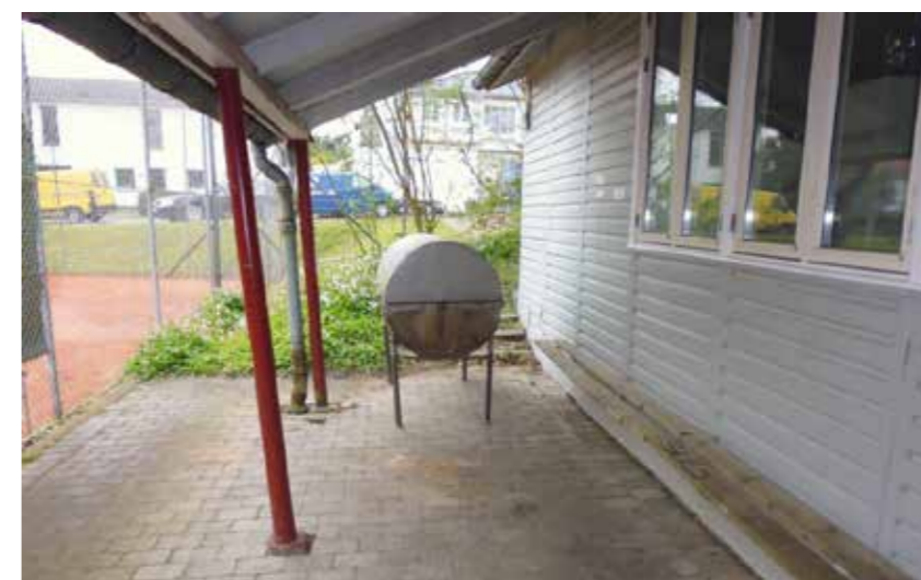
Terrassen foran Annekset ud mod tennisbanerne

I spørgeskemaundersøgelsen deltager tre af de seks foreninger, der har adgang til Annekset, nemlig Gentofte Svømmeklub, Gentofte Volley samt Skovshoved Triathlon Klub 5 .