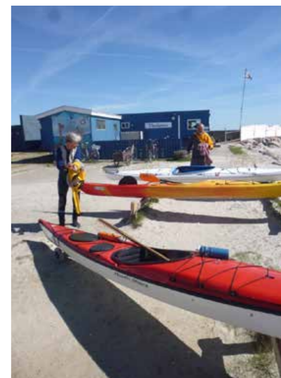
Det sociale samvær udspiller sig på terrassen foran klubhuset alt imens 60+ medlemmerne vender tilbage fra deres roture i farvandet syd for Køge.