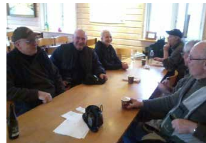
Kaffe og øl og livlig snak ved bordene i Hedehusene-Fløng Jagtforening.

Da jeg besøger foreningerne ved Skydebane Vest er der en livlig aktivitet i området. Ude på området omkring skydebanerne og på terrassen foran den store træhytte er der masser af mennesker samlet. Det er vanskeligt at se, hvem der hører til hvor og der skydes på kryds og tværs på arealet. Indenfor i klubhuset i Hedehusene-Fløng Jagtforening hersker der ligeledes en særdeles livlig aktivitet og stemningen er høj. Der er et sandt mylder af folk ud og ind af huset. Flere mænd står i kø ved lugen til kontoret for at indskrive sig til en runde på skydebanen. Jeg sætter mig ved et af langbordene og falder i snak med et par af de yngre medlemmer i lokalet - en kvinde på 29 og en ung fyr på 16 år. Rundt omkring os i lokalet står en mænd og snakker. De drikker kaffe og øl, men mest øl. En kvinde på 29 fortæller, at hun er her fordi hendes kæreste er medlem af foreningen og kommer her rigtig meget. (Observationsbesøg, april 2015).