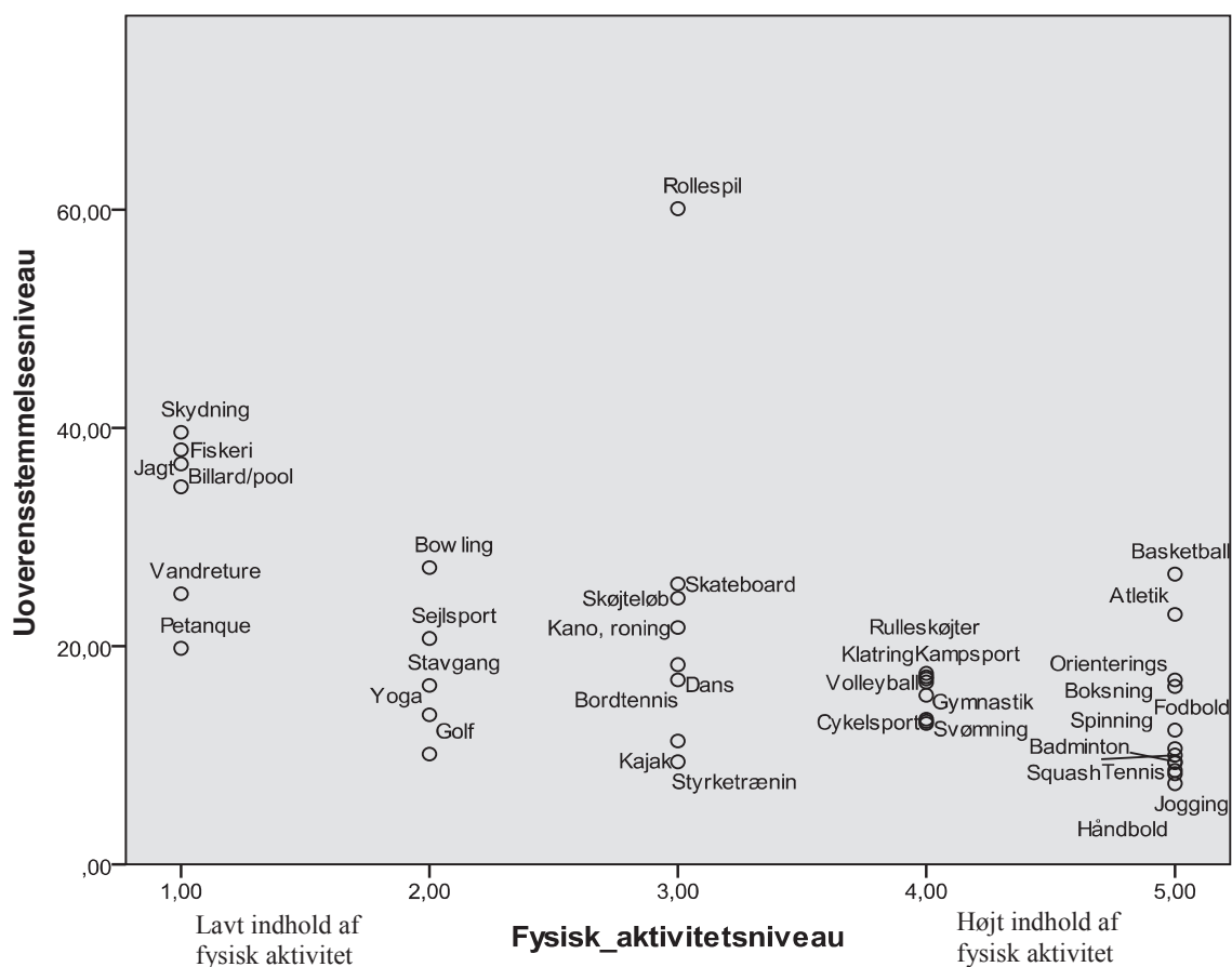
Figur 1. Bivariat sammenhæng mellem fysisk indhold og uoverensstemmelse for forskellige aktiviteter.

Uoverensstemmelsesniveauet er givet ud fra, hvor stor en andel, der har angivet at dyrke en aktivitet, men som ikke anser sig selv for at dyrke sport eller motion. Dvs. 60 % af alle rollespillere mener ikke, de dyrker sport eller motion.